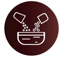
Procedimiento de mezclado